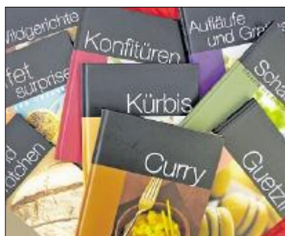
Praktische Kochbücher. (Manuela Merk)

Auch Raclette gehört in die kalte Jahreszeit. Dass man für dessen Zubereitung mehr als nur Käse aufstischen kann, lässt sich im gleichnamigen Büchlein nachlesen.